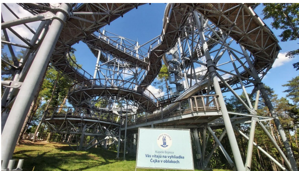
Obr. 4 Vyhliadková veža Čajka v oblakoch

Kúpele Bojnice sa podieľajú na rozvoji cestovného ruchu a na skvalitňovaní zážitkov návštevníkov nielen prostredníctvom balneoterapie, liečebnej rehabilitácie, služieb kúpeľného cestovného ruchu a vytváraním príjemného estetického prostredia, ale aj investíciami do ďalšieho rozvoja turizmu. Manažment kúpeľov s ďalšími partnermi investoval do výstavby a prevádzky vyhliadkovej veže Čajka v oblakoch (Obr. 4), ktorá sa nachádza len 10 min. jazdy autom od kúpeľov. Vyhliadková veža je situovaná v peknom borovicovom lese nad bojnickou kalváriou.