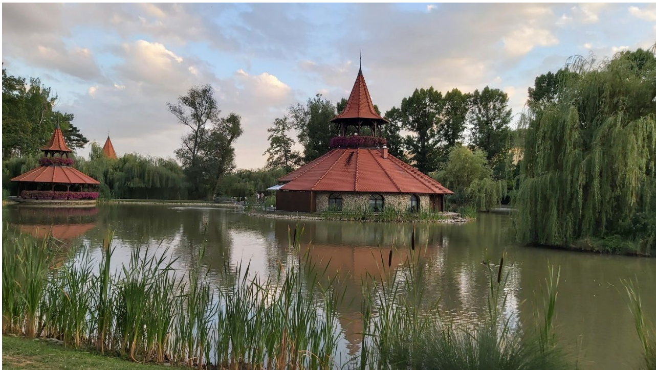
Obr. 3 Kvetinami ozdobenú vežičku má aj reštaurácia (v strede) a vyhliadka pri jazere (vľavo)