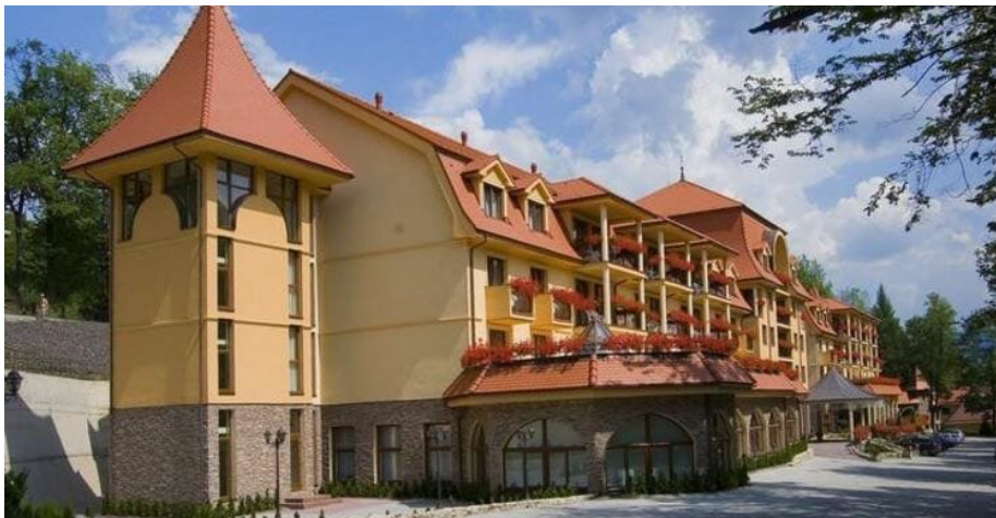
Obr. 1 Liečebný dom Lysec

Pre pacientov a návštevníkov kúpeľov Bojnice je k dispozícii niekoľko liečebných domov: Lysec (Obr. 1), Mier, Bôrina (bývalý LD Baník), Lux, Slávia, Gabriela, Tríbeč, Zobor, Klak, Leknín, Veľčický dom, Kúpeľný mlyn.