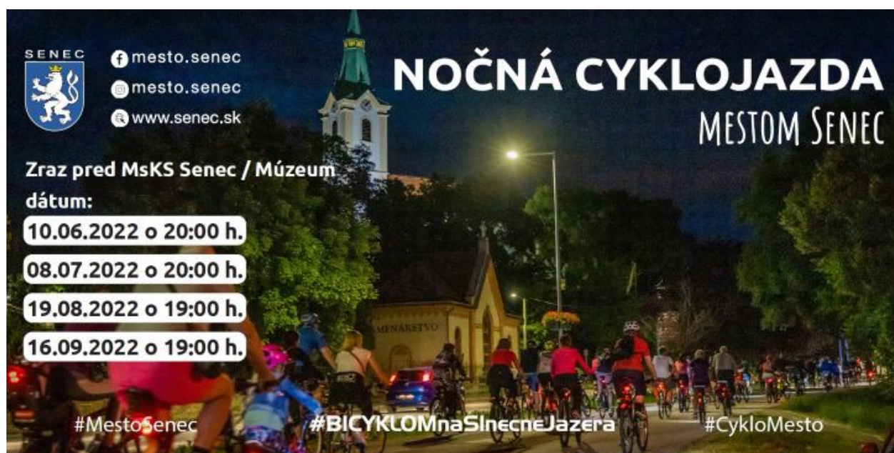
Obr. 3 Nočná cyklojazda mestom Senec

V rámci cykloturizmu mestská samospráva, OOCR Senec a ďalší aktéri pravidelne organizujú Nočnú cyklojazdu mestom Senec (Obr. 3).