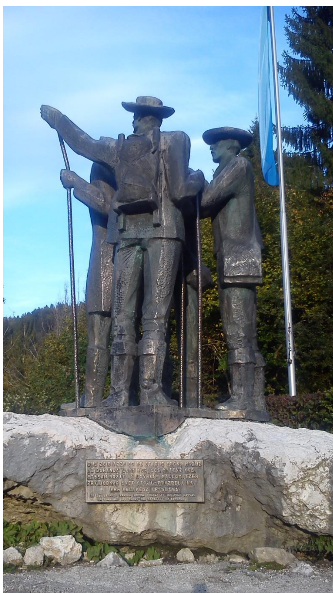
Obr. 2 Štyria horolezci, ktorí ako prví vyliezli na Triglav – najvyšší vrch Slovinska

Za pekného počasia je z Bohinjského jazera možné dovidieť až na Triglav (2 864 m n. m.) – na najvyšší vrch Slovinska a Julských Álp. Symbol Triglavu – tri vrcholy – sú znázornené aj na slovinskej vlajke. Na Triglav prvýkrát vyliezli štyria horolezci v r. 1778, ktorí pochádzali práve z Bohinja. Na ich pamiatku je neďaleko jazera postavené súsošie zobrazujúce horolezcov, ako ukazujú na Triglav (Obr. 2).