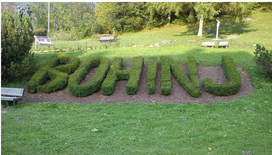
Obr. 4 Nadpis vytvorený z medonosných kríkov

V Bohinji si obyvatelia skrášľujú verejné prostredie tým, že vysádzajú rastliny, trvalky, cibuloviny a kríky, ktoré sú dôležité pre včely (Obr. 4). Tieto medonosné rastliny poskytujú včelám dostatok potravy počas celého roka. V parkoch, popri miestnych cestách a v domácich predzáhradkách môžeme vidieť levanduľu alebo šalviu, ktoré dokážu počas roka viackrát zakvitnúť, potom fialový okrasný cesnak, echinaceu, nechtík, krušpán, rozmarín, tymián a ďalšie byliny.