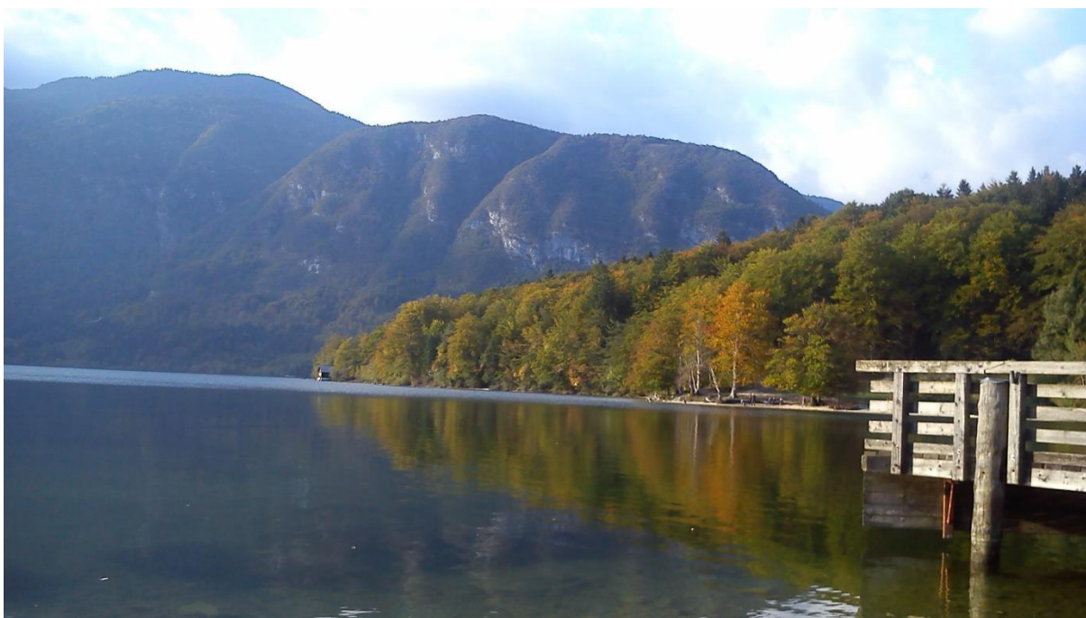
Obr. 1 Bohinjské jazero v Julských Alpách

Pomenovanie Bohinjské v slovinčine znamená božské, a autori tým chceli poukázať, že ide o „božsky“ krásne jazero nachádzajúce sa uprostred Julských Álp. Tie sú tvorené strmými vrcholmi, zelenými údoliami a na úpäť a v podhorí Álp dedinkami a mestami.