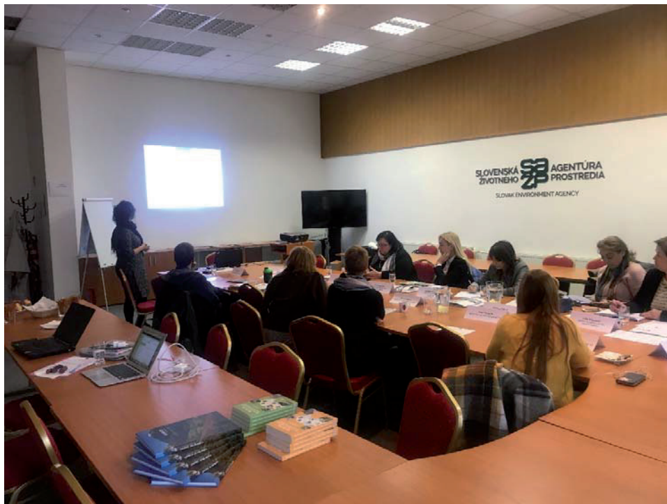
Obr. 4: Študijná návšteva expertov z Čiernej hory do SAŽP

Výsledkom podujatia je posilnenie spolupráce nielen v rámci siete Eionet ale aj v iných odborných témach.