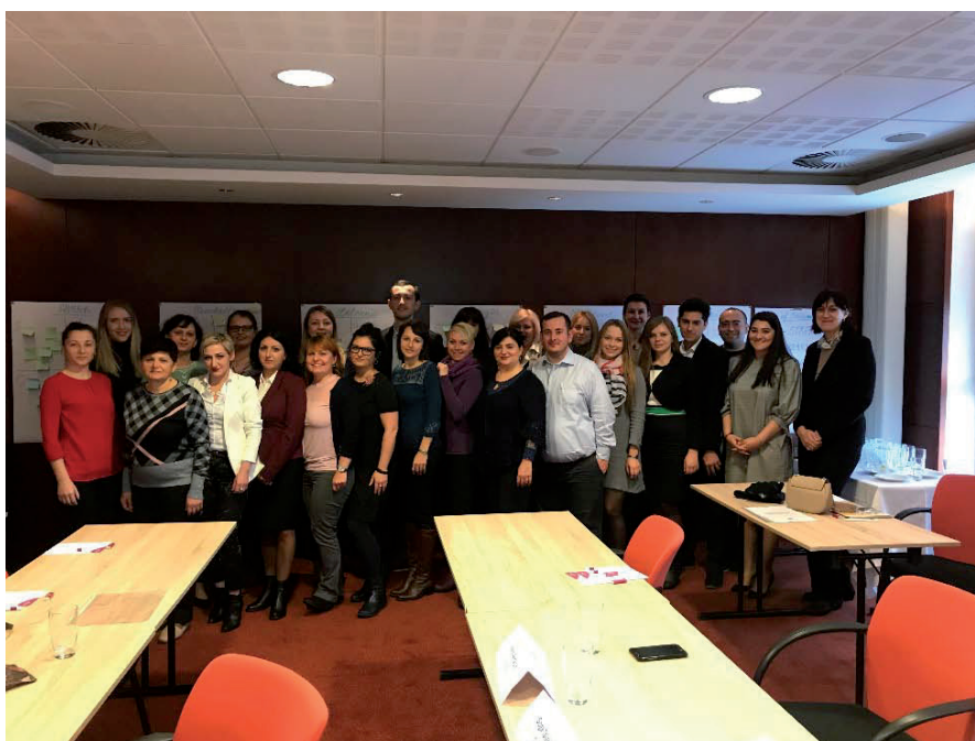
Obr. 3: Úvodný míting – workshop o Správe o stave ŽP, Bratislava

Hlavným cieľom projektu je podporiť ďalšiu implementáciu princípov Zdieľaného environmentálneho informačného systému (SEIS) v šiestich východných krajinách. Špecifickým zameraním projektu je posilniť pravidelnosť tvorby environmentálnych indikátorov a hodnotenia ako príspevok k tvorbe politiky založenej na vedomostiach. Celkovou metódou implementácie navrhovanej činnosti je používanie modelu Eionet ako modelu implementácie SEIS v regióne východného partnerstva. Podpora a odborné znalosti odborníkov zo siete Eionet budú zohrávať kľúčovú úlohu pri realizácii projektových aktivít, najmä pri budovaní kapacít a pri prenose skúseností pri uplatňovaní overených postupov, nástrojov a systémov používaných v kontexte EÚ a EEA. Výsledkom bude zlepšenie národných kapacít súvisiacich s poskytovaním environmentálnych údajov a informácií v súlade s národnou legislatívou a právnymi predpismi EÚ v oblasti životného prostredia.