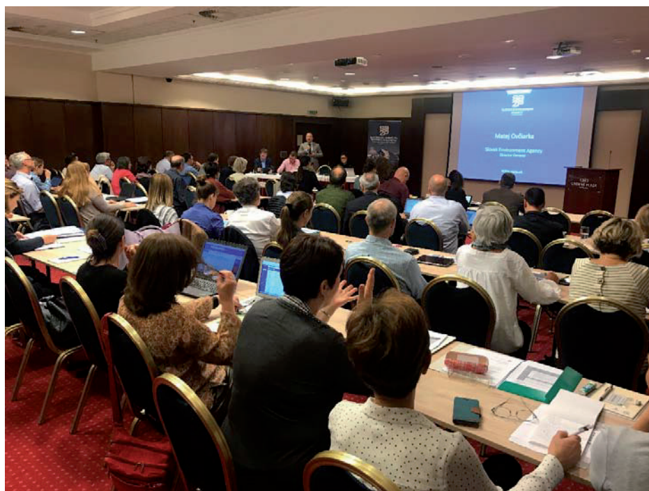
Obr. 2: Spoločný míting Európskej environmentálnej agentúry