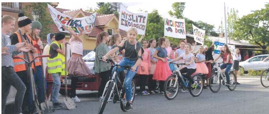
SYSTEM VEREJNEJ HROMADNEJ DOPRAVY V MALACKÁCH

V oblasti Mestská mobilita získalo ocenenie mesto MALACKY. Odbornú komisiu presvedčilo aktívnym prístupom k riešeniu problematiky mobility v meste, so zapojením obyvateľov a partnerov, rozvojom a podporou cyklistickej dopravy, strategickými riešeniami a najmä zavedením mestskej hromadnej dopravy.