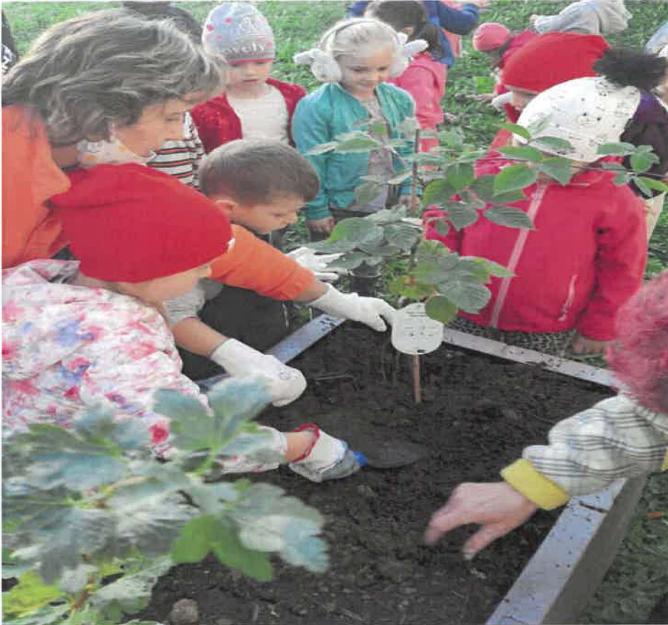
Jedlé sady v MŠ Rúbanisko I.