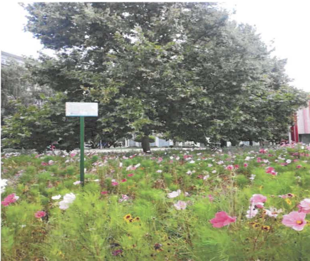
Kvitnúca lúka v centre mesta