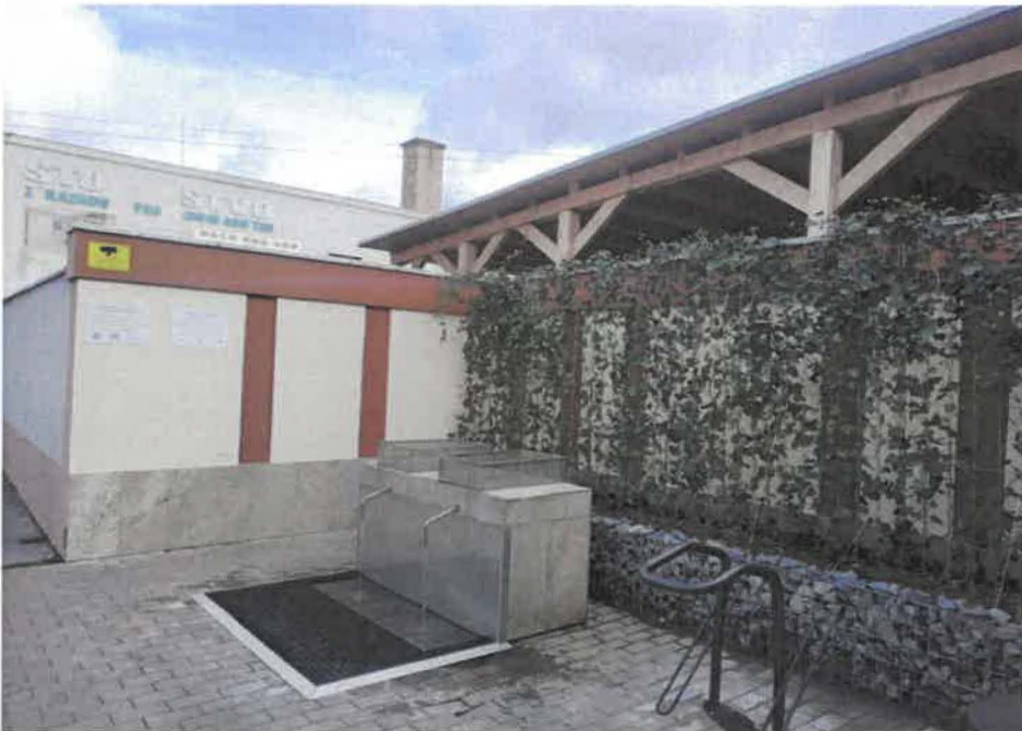
Artézská studňa v novom šate". Zelená stena, vďaka ktorej sme uprostred betónového priestoru vytvorili príjemnú zelenú oázu.