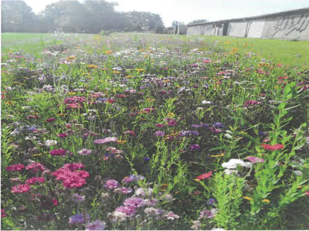
Kvitnúca lúka na sídlišku Rúbanisko