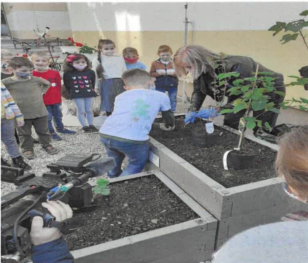
Jedlé sady v ZŠ M.R.Štefánika