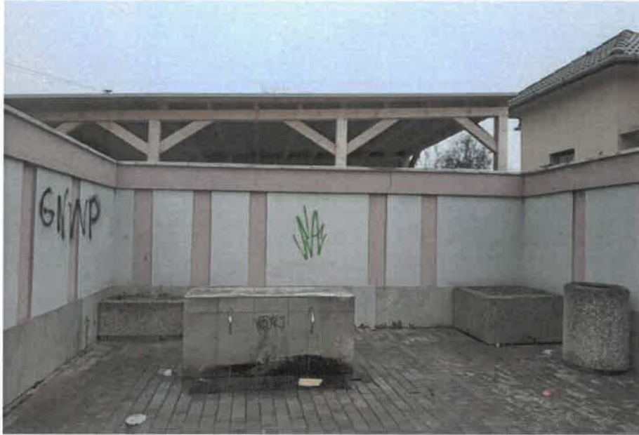
Artézská studňa na Ulici Z.Nejedlého v pôvodnom stave.