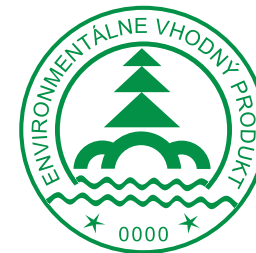
Environmentálne vhodný produkt