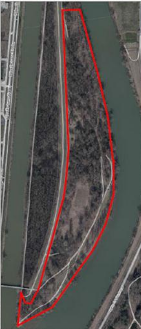
Ortofotomapa s vyznačenými hranicami obecného chráneného územia LIDO